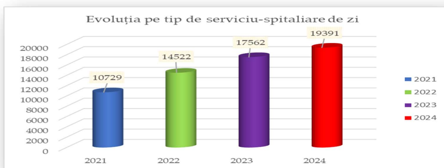
Grafic nr. 3 Evoluția pe tip de serviciu, în perioada 2021-2024-spitalizare de zi