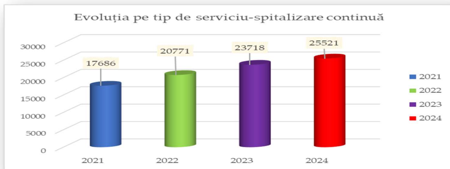
Grafic nr. 2 Evoluția pe tip de serviciu, în perioada 2021-2024-spitalizare continuă