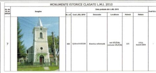
MONUMENTE ISTORICE CLASATE I.M.B.I. 2010